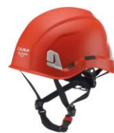
1 - Rosso