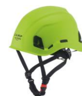
6 - Verde