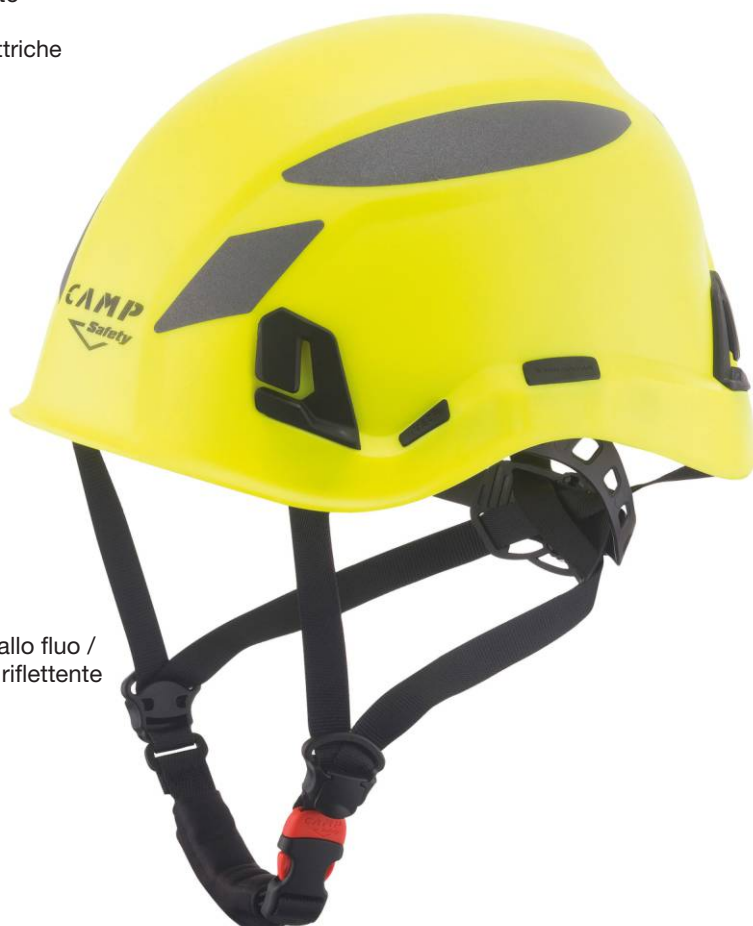
3 - Giallo fluo / Grigio riflettente