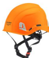
4 - Arancio

ROPE ACCESS TREE CLIMBING CONFINED TOWERS/INDUSTRY ROOFS CONSTRUCTION PLATFORMS