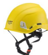
5 - Giallo