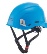
2 - Azzurro