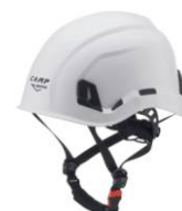
7 - Bianco