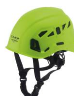
6 - Verdew