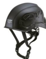
8 - Nero