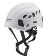
7 - Bianco