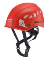
1 - Rosso