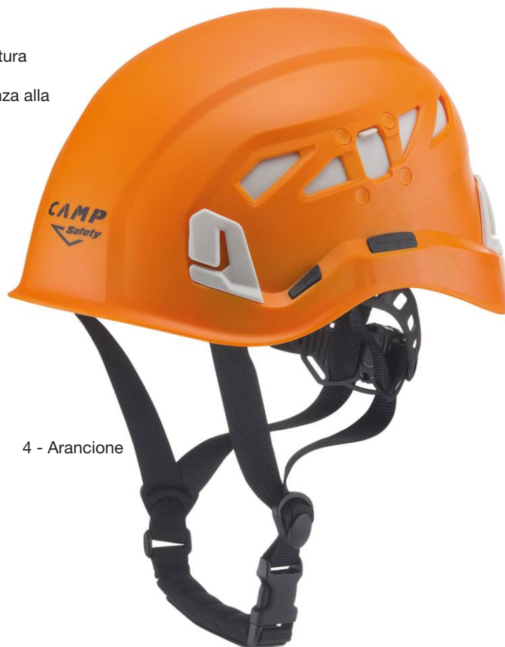
4 - Arancione