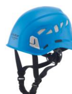
2 - Azzurro