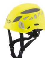
3 - Giallo fluo / Grigio riflettente